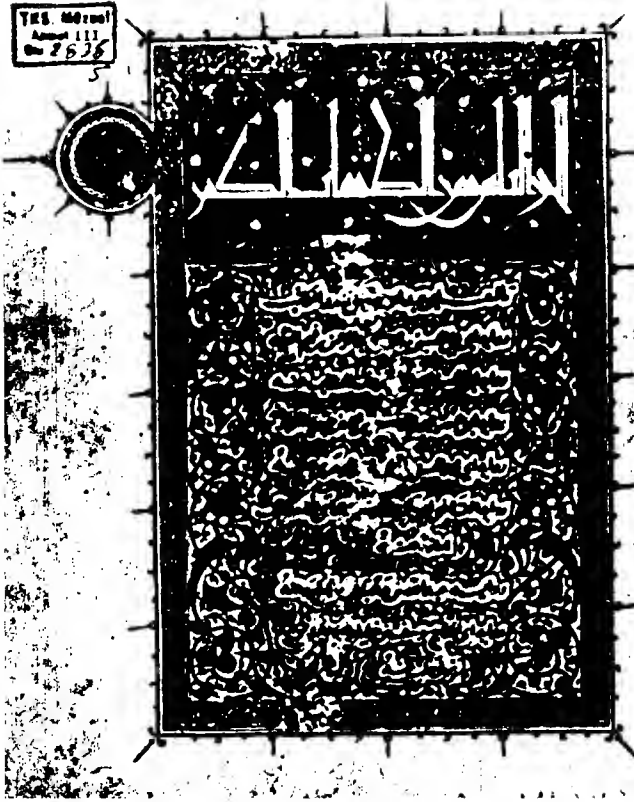
غلاف المجلد الثامن من نسخة أحمد الثالث