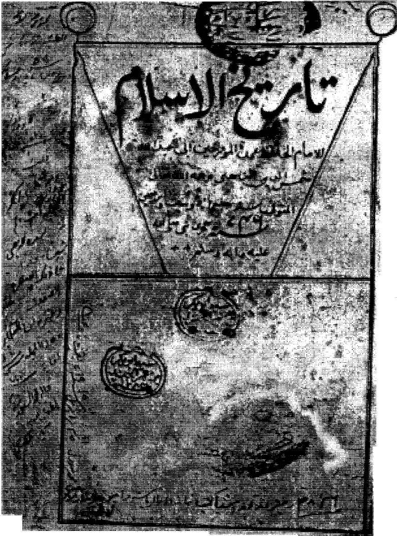
طرة مجلد رضا رامبور بالهند رقم ٣٥٣٣، وهو مختصر لتاريخ الإسلام